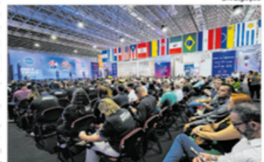
Evento terá palestras e mesas de debates